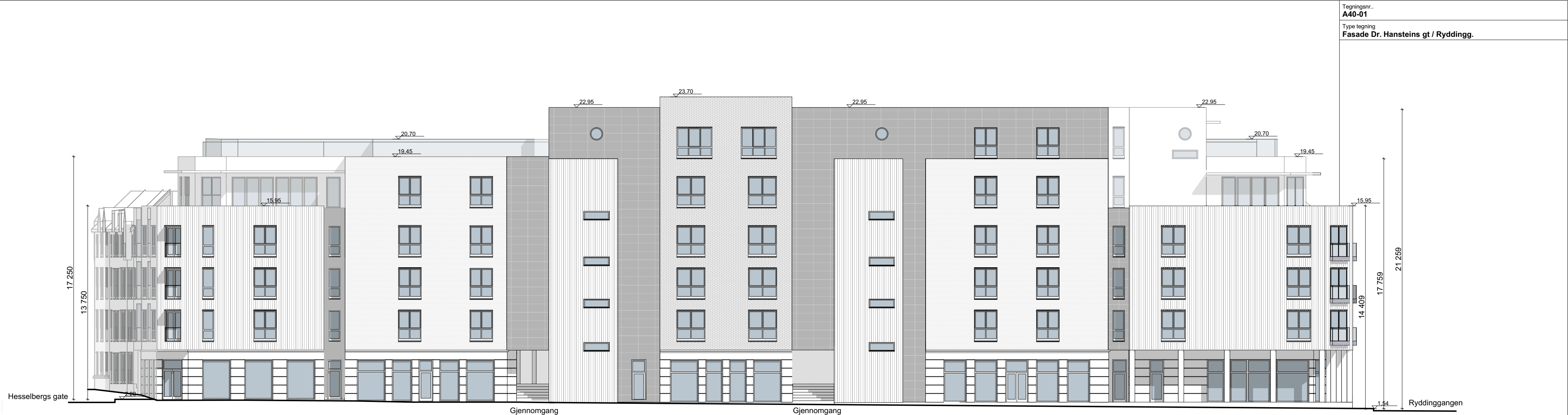
1:200 Fasade Dr Hansteins gate