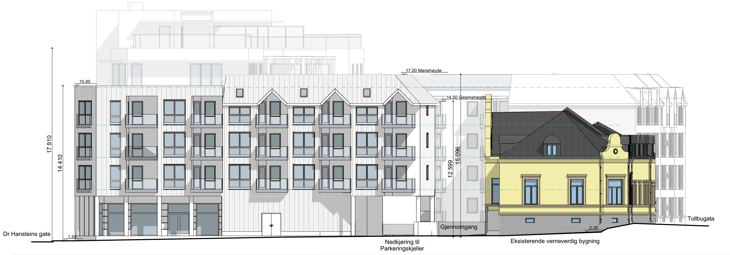
1:200 Fasade Ryddinggangen

Tegningsnr. A40-01 Type tegning Fasade Dr. Hansteins gt / Ryddingg.